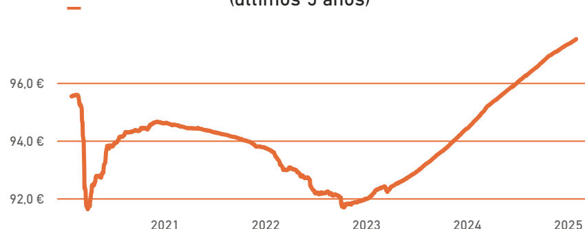
Rendibilidade Anualizada (%) em 31-01-2025